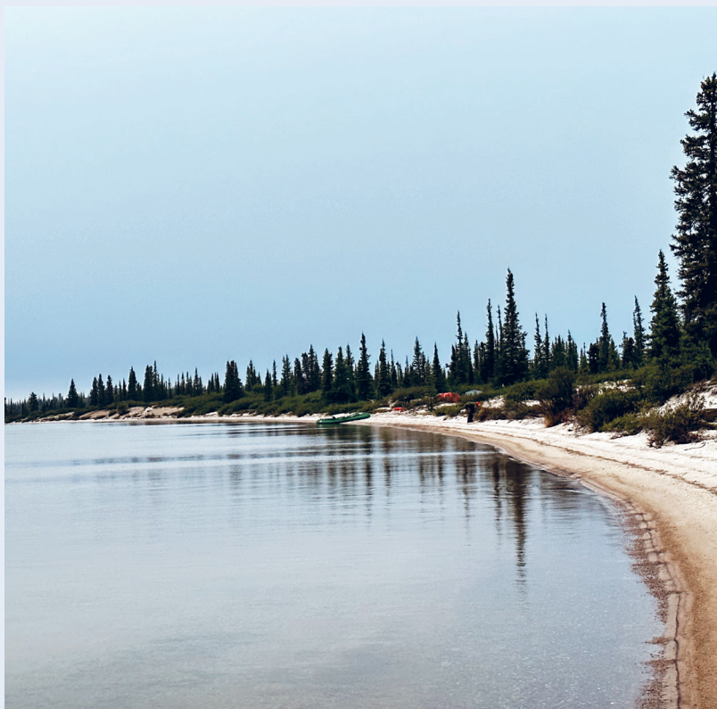
Kveldsstemning med etablering av camp.