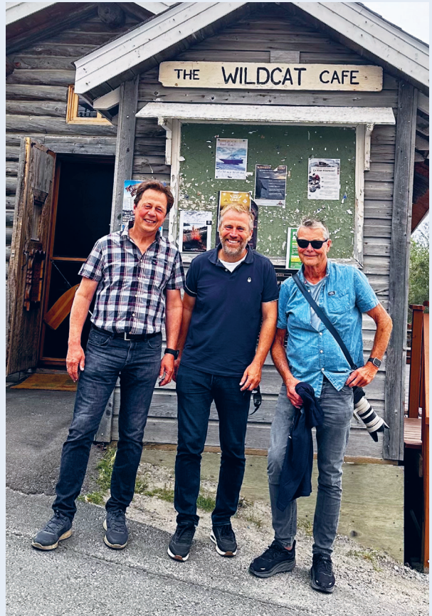
Avslutning på The Wildcat Cafe! Eldste restaurant åpnet under klondike i 1937. En tur innom der anbefales om man er i Yellowknife. God stemning og historisk sus.