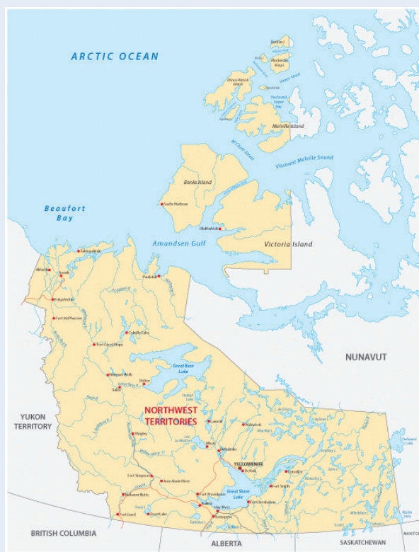
Nordvestterritoret: Høres stort ut, og er stort. Nordvestterritoret er en amerikansk betegnelse på det ca. 640 000 kvadratkilometer store området mellom Ohio-elven, Mississippi-elven og Lake Ontario.