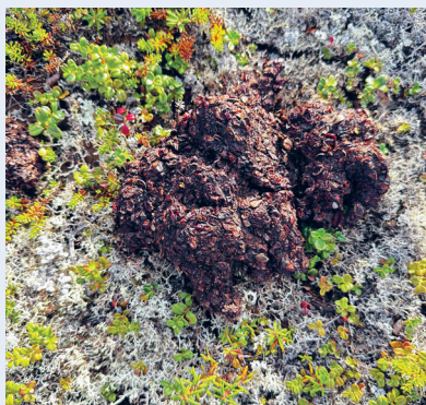
Bjørnebærsj ved leir. Heldigvis gammel og uttørket. Vitner om at bær står øverst på menyen.