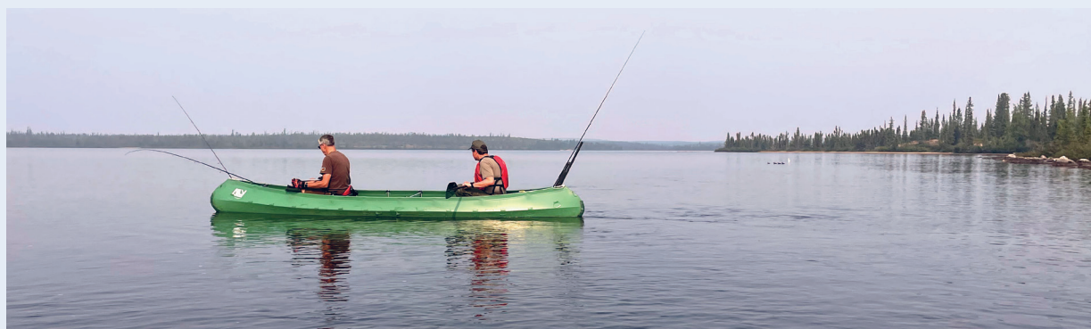
Ute etter dagens fangst. Tar som regel ikke lang tid.