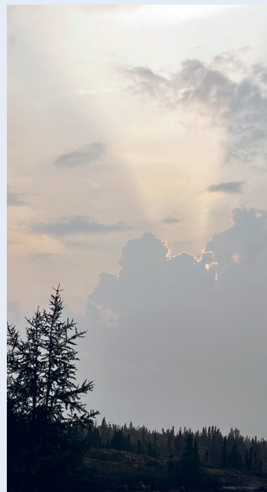
Slike syn kan gi tanker om mangt og meget. Høst i anmarsj.