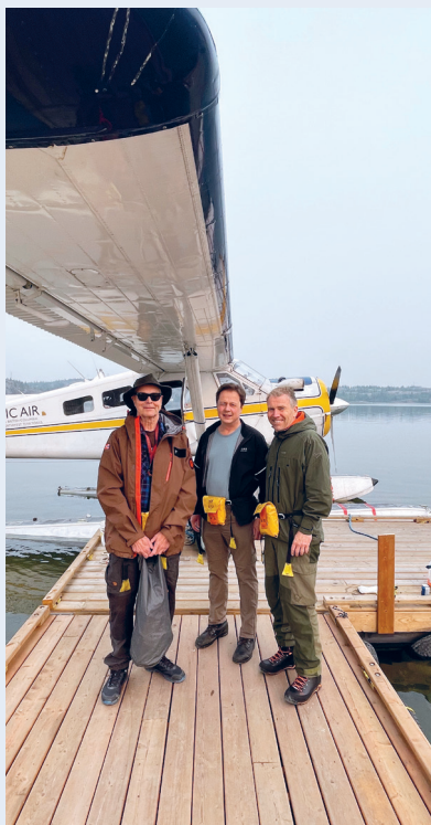
Spenningen stiger. Klart for ombordstigning i et De Havilland U6-A Beaver, et legendarisk fly fra 1959, og en begivenhet i seg selv.

tundraen hadde vi nødvendig utfordret sikkerheten. For å ivareta sikkerheten hadde vi med satelittelefon og hver av oss hadde i tillegg Garmin Inreach for kommunikasjon innad i gruppen og ut av området. Med vektbegrensninger for utreise med sjøfly, pakker vi utstyr og proviant. Fra Yellowknife krysser flyet over Store Slavesjø i nordøst. Flyturen tilsvare Oslo-Trondheim i distanse. Vi ankommer start-koordinatet for turen i strålende sommervær. Piloten ønsker oss god tur og flyduren forsvinner i det fjerne.