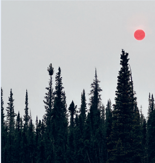
Slik så solen ut en vakker dag. I ly av røykdisen fra skogbrann langt unna. Det var mange skogbranner i 2023.