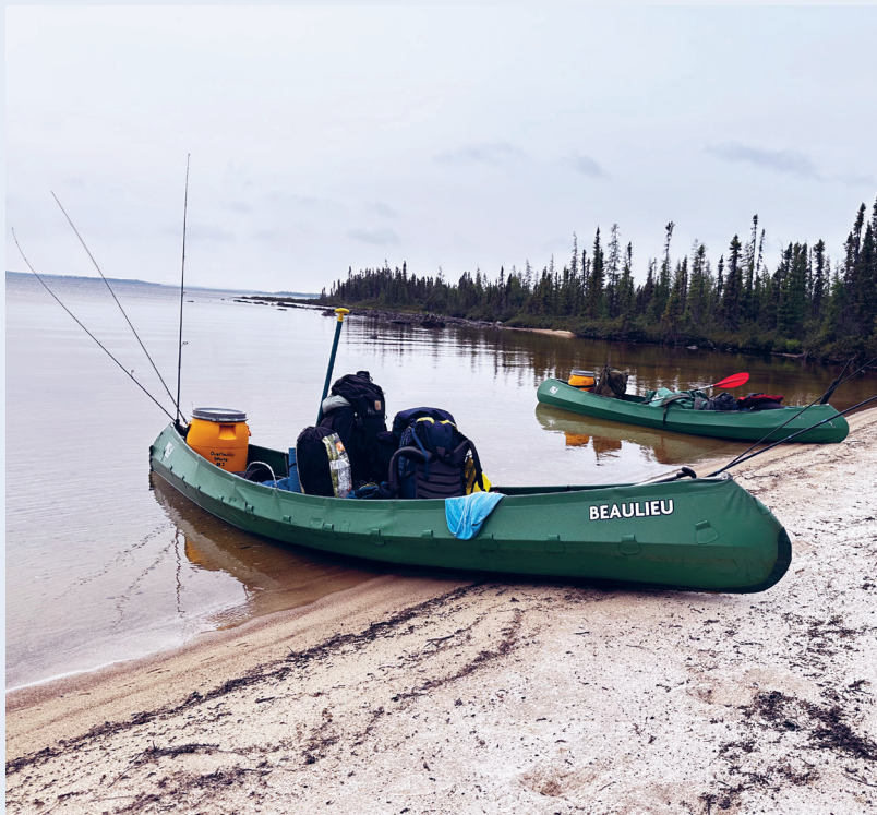
Strandhugg første dag. Disse strendene får sjelden besøk av mennesker.