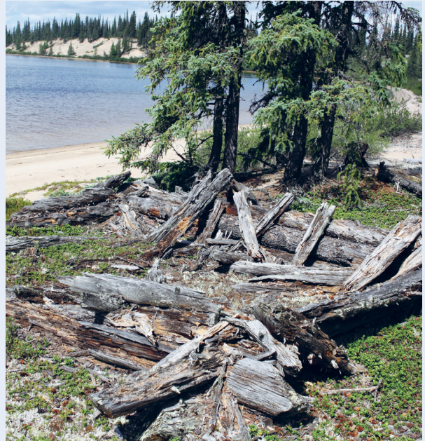
Rester av en cirka 100 år gammel fangsthytte.