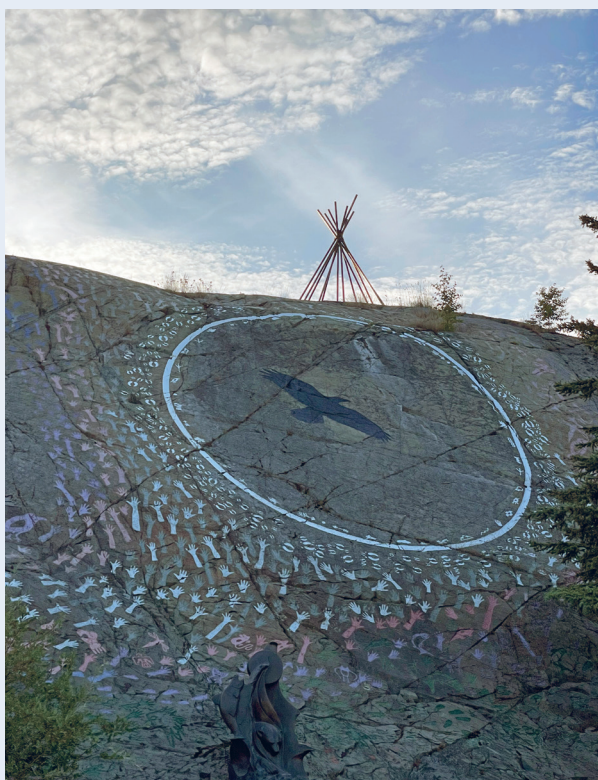
Bymonument Yellowknife.

Vi ankommer gruvebyen Yellowknife med fly fra Vancouver. Yellowknife har vært hovedstad i NVT fra 1967 (3). Byen har gjennom lange tider vært et handelssentrum i munningen av Yellowknife River. Yellowknife fikk bystatus etter funn av gull i 1934. Utviklingen av byen har pulsert i takt med gullforekomster og gullrush. Den siste gullgruven stengte i 2004 (4). Reserver av diamanter ble oppdaget og er blitt utvunnet siden midten av 1990-tallet. Skiltet «Capital of diamond industry of North America» møter oss på vei fra flyplassen og inn til byen. Vi har tre dager til rådighet for forberedelser til vår tur videre. Harald og Jan er på sin fjerde tur til dette området, og Jørn debutterer. Erfaringer fra tidligere turer er til stor nytte. Det er mange tanker og utstyr