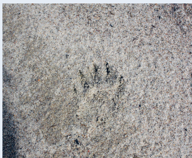
Noen lusker rundt med store klør. Dette er en prærieulv. Ingen småtass.