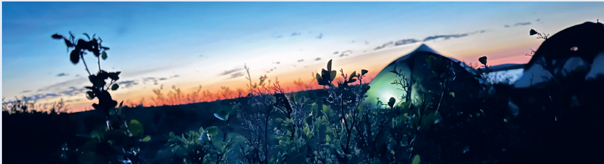
En natt av de sjeldne er i anmarsj. Aurora Borealis kommer ofte på besøk når alt blir svart.