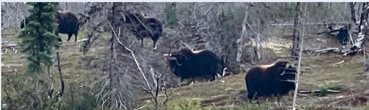
Våre firbente moskusvenner dukket opp til stadighet. De oppførte seg alltid pent.