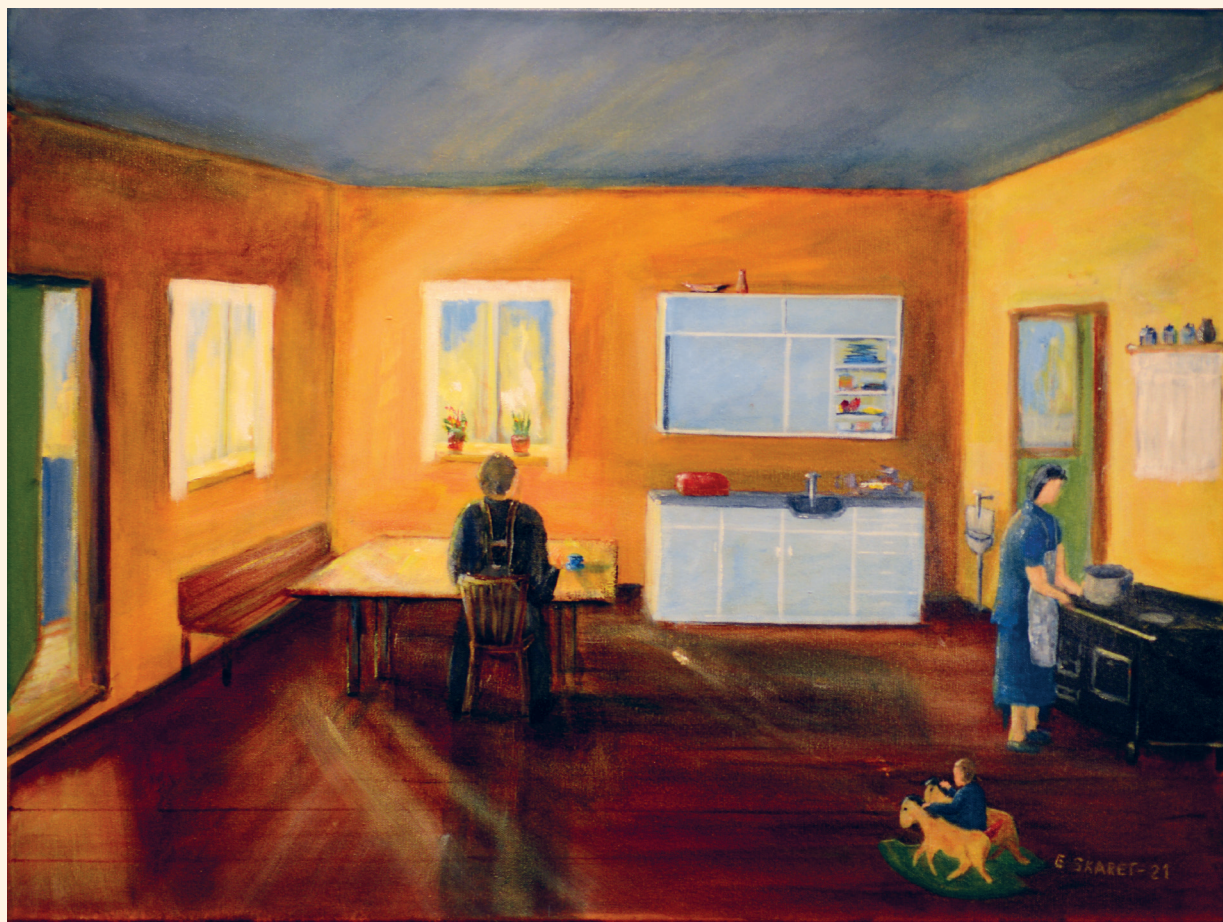
«Nybu» heter dette bildet, malt av Erik Skaret. Akryl på lerret.

få hjelp i dag. Men først må tannlegen hente ei pakke nede på stasjonen. Han spiser ei brødskive i bilen på vei ned. Veiene, som i morges var glatte, er nå strødd. Han svinger inn på stasjonsområdet, der det er ei stripe med sand over torget og ut igjen på andre sida. I det han krysser torget ser han ledige parkeringsplasser, og impulsivt svinger han inn til høyre. I neste sekund forstår han hva som kommer til å skje: Her er det ikke strødd, det er blank is, han har ingen muligheter for å stoppe eller svinge, og det som nå skjer er det umulig å unngå – han er på vei rett mot det store juletreet som velforeningen setter opp hvert år. Et kraftig smell høres i det bilen treffer. Treet knekker som ei fyrstikk, «deiser» i asfalten, det smeller som fra et automatvåpen da lyspærene på treet knuses i fallet. Han blir sittende i bilen, trekker pusten rolig, og ser på at folk kommer ut av butikkene på andre siden av veien. Han innser fort at det er