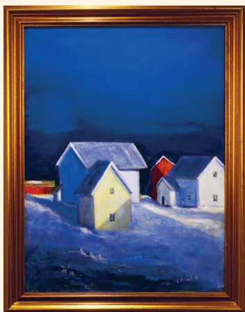
«Lyset» er brukt som omslagsbilde på romanen «Dansen» som kom ut i år. Akryl på lerret.

– Da vi under opptellingen passerte 65 000 kroner, begynte jeg å grine. Pengene er blitt brukt både i Ukraina og i Gaza. Det er fantastisk å tenke på, sier Skaret.