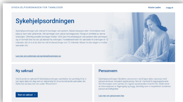
Forsiden til den nye søknadsportalen for Sykehjelpsordningen, som møter den som skal søke bidrag fra ordningen.

– Det er alltid noen ting som ikke fungerer optimalt, og i denne lanseringen er det snakk om noen få feil og ting